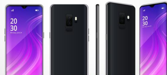
บริษัทโทรศัพท์มือถือยี่ห้อหนึ่ง แถลงการณ์ กรณีเรียกคืนโทรศัพท์มือถือ