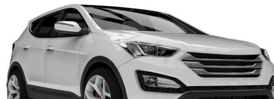
ล๊อคประตูมีปัญหา บริษัทรถยนต์ยี่ห้อหนึ่ง เรียกคืนรถ 2.15 ล้านคันในสหรัฐฯ